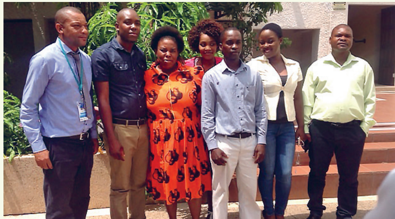
Fornøyde deltakere fra privat sektor i Zambia på seminaret i Livingstone.

På seminaret vekslet man mellom plenumsdiskusjoner og gruppesamtaler, og deltakerne var entusiastiske over ny innsikt og ny kompetanse. Verdien av samhandling mellom privat og offentlig sektor ble av flere beskrevet som en «eye opener». Flere av representantene fra de to landene utvekslet kontaktinformasjon på regionalt nivå.