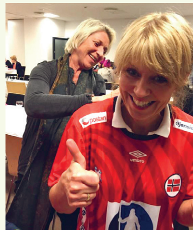
Innleggsforfatteren fikk signert landslagsdrakt som hun solgte for 6000 kroner. Pengene gikk til studier for en ung kvinne i Uganda.

Har du endret bostedsadresse? Logg deg inn på Min Side ( www.negotia.no ) og rett opp profilen din.