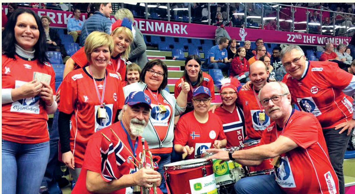
Engasjert YS-gjeng som heiet fram de norske håndballjentene til VM-seier.