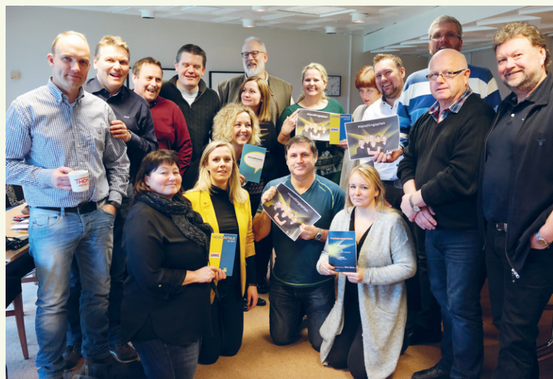
Vi har en plan! På klubbkurset forrige måned utviklet Negotia Ahlsell planer for videre drift og vekst.