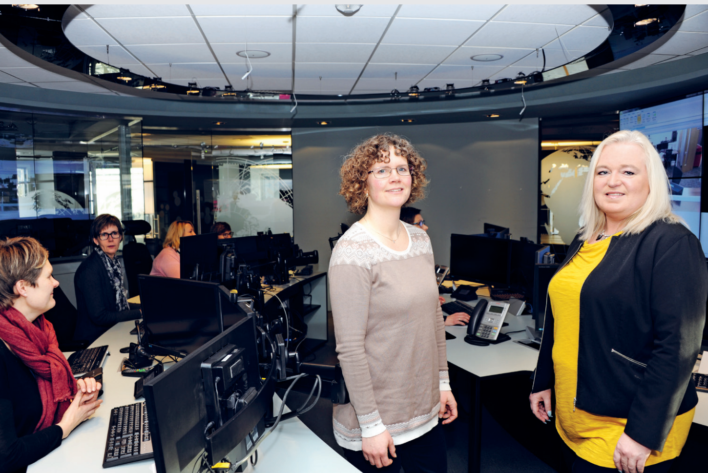
«Worldwide». Selskapet er til stede i alle verdenshjørner og styres fra hovedkontoret på Kongsberg.