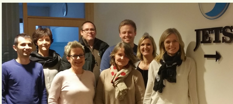
Vind i seilene. Den nokså nystartede klubben ved Jets Vacuum har nettopp fått på plass tariffavtale.

For andre gang på under et halvt år, har Negotia sentralt i regi av avdeling Ålesund, besøkt medlemmer og klubber i avdelingen.